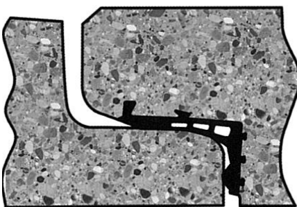
Dichtung ROBUST®-Plus mit Anschlag